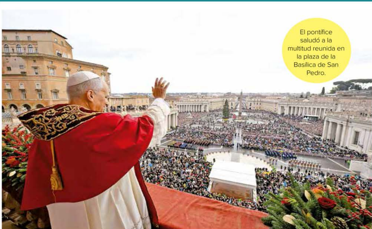
El pontífice saludó a la multitud reunida en la plaza de la Basílica de San Pedro.