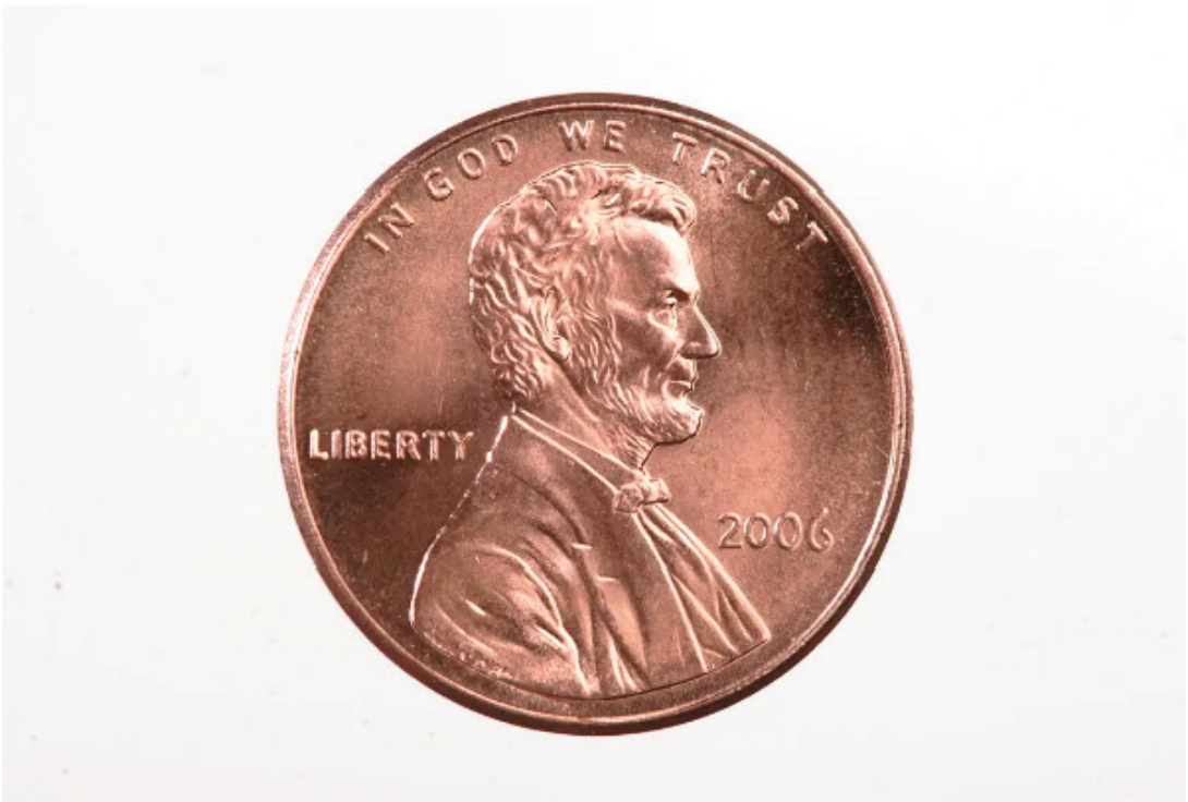
El centavo, que se pagaba por las ideas — en la frase coloquial “a penny for your thoughts” — , pero no por muchas otras cosas, murió el miércoles en Filadelfia.

En el lado más oscuro, un penny podía ser indudablemente malo, sobre todo cuan-