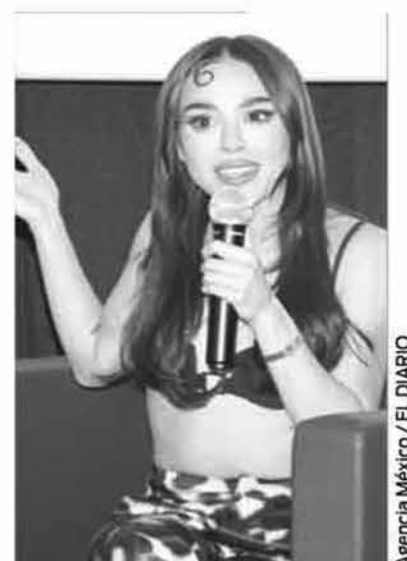
LA ACTRIZ y cantante hizo las declaraciones en un programa de radio chileno.

No obstante, también salieron los fans incondicionales de Danna que no dudaron en defenderla de los ataques y solicitaron detener el "hate" (odio) contra la actriz y cantante, asegurando que desde hace algunos meses la critican por cualquier situación.