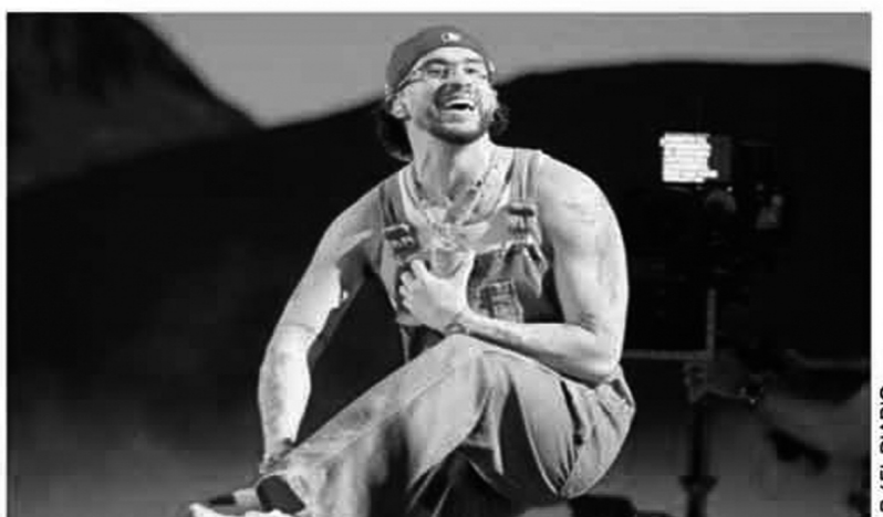
LA GIRA arrancará el próximo 21 de febrero en Estados Unidos.

Por el momento se ha confirmado que la gira se concentrará mayormente en diversas ciudades de los Estados Unidos, pero se espera que durante los siguientes meses se anuncien nuevas fechas