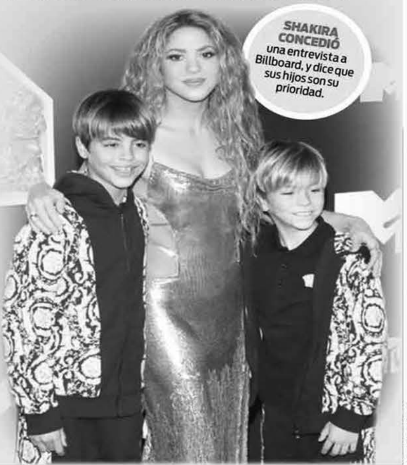
SHAKIRA CONCEDIÓ una entrevista a Billboard, y dice que sus hijos son su prioridad.

"Cuando se destroza una familia, creo que no hay nada que pueda compensar ese dolor. Claro, tengo que seguir adelante por mis hijos y esa es mi mayor motivación. Pero mi más grande sueño en la vida, más que coleccionar discos de platino y Grammys, era criar a mis hijos con su padre, tener una familia, ¿sabes? Pasar por encima de los problemas, de los obstáculos y superarlos, y envejecer al lado de alguien. Esto ya sé que no lo voy a tener".