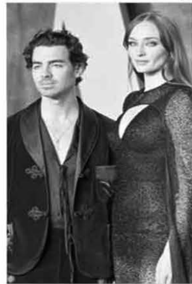
LA EXPAREJA acaba de iniciar un pleito legal por sus dos niñas.

En abril de este año se mudaron oficialmente a una casa en la campaña inglesa mientras Sophie comenzaba a grabar la mini-serie Joan, y acordaron tras pensarlo muchos que las niñas viajarían con Joe cuando él comenzara su gira mundial porque contaría con más tiempo libre para atenderlas.