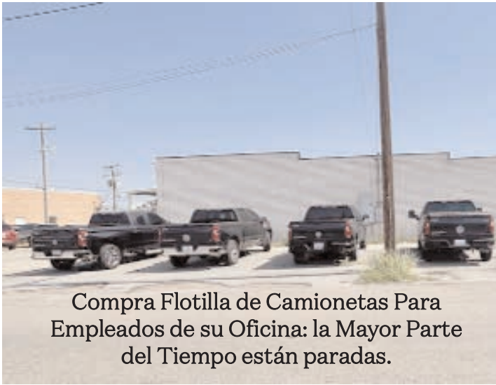
Compra Flotilla de Camionetas Para Empleados de su Oficina: la Mayor Parte del Tiempo están paradas.