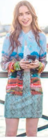
BangShowbiz / EL DIARIO

Tras meses de especulaciones, finalmente se ha anunciado que será Lily Collins quien protagonice el live action de Polly Pocket. La elección de la actriz ha sido muy elogiada, ya que su versatilidad actoral y carisma, encajan perfectamente con la esencia de la muñeca. (AGENCIAS)