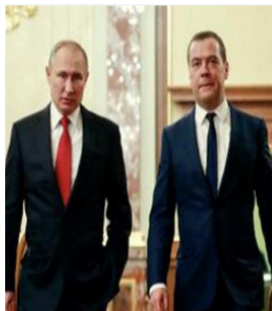
Para Zelensky lo importante en este momento es que Ucrania va a una Rusia desmotivada en el campo de batalla.

Zelensky dijo además que creía que "los rusos necesitan pensar en cómo cambiar el clima en su propio país, su régimen, y luego pueden preparar a su sociedad para cualquier posibilidad diplomática de poner fin a esta guerra" dijo.