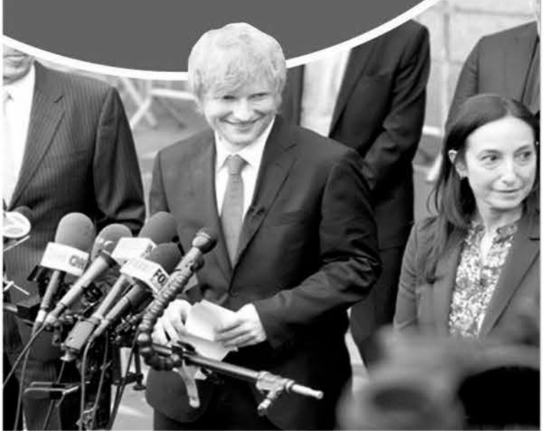
EL BRITÁNICO salió absuelto de la demanda de plagio.