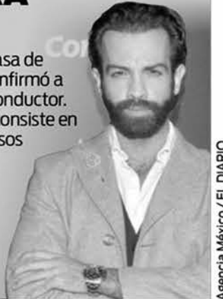
Agencia México / EL DIARIO

La producción de La casa de los famosos México confirmó a Diego de Erice como conductor. El reality de Televisa, consiste en que un grupo de famosos se aislará del mundo (por unos meses) en una casa que estará vigilada por cámaras las 24 horas del día. (TELEVISA)