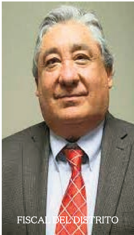
FISCAL DEL DISTRITO

“un acusado que está detenido en la cárcel a la espera del juicio de una acusación en su contra debe ser puesto en libertad bajo fianza personal o mediante la reducción del monto de la fianza requerida, si el Estado no está listo para el juicio de la acción criminal por la cual está detenido. Dentro de: (1) 90 días desde el comienzo de su detención si es acusado de un delito grave”.